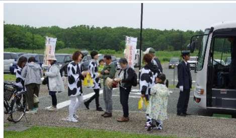
ゴミのポイ捨て防止啓発活動