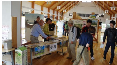
サロベツ・エコモーDay