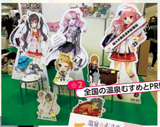
※2 全国の温泉むすめとPR!