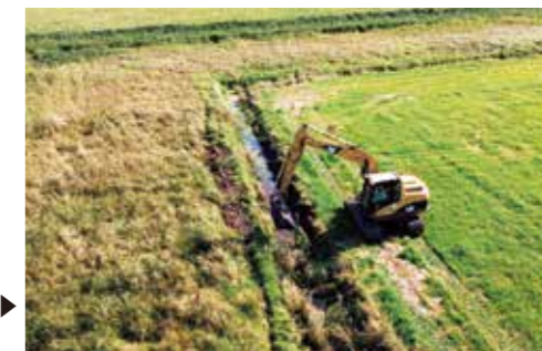
明渠排水 浚渫作業