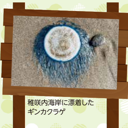
稚咲内海岸に漂着したギンクラゲ

稚咲内海岸では、10月になるとギンクラゲと呼ばれる面白いクラゲの仲間が漂着することがあります。観察してみると青い色をした触手が硬質のような盤状の浮きの周りに生えている姿をしているのがわかります。実はこの姿はまだ子どもなのです。