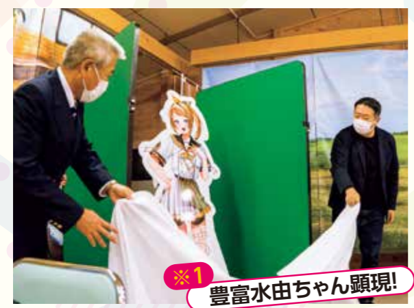
※1 豊富水由ちゃん顕現!

ファンの中で現地にキャラクターパネルが設置されることの総称。 水由ちゃんはデビューから約2カ月後の11月4日に豊富温泉へ 顕現し、現地コラボがスタートしました!