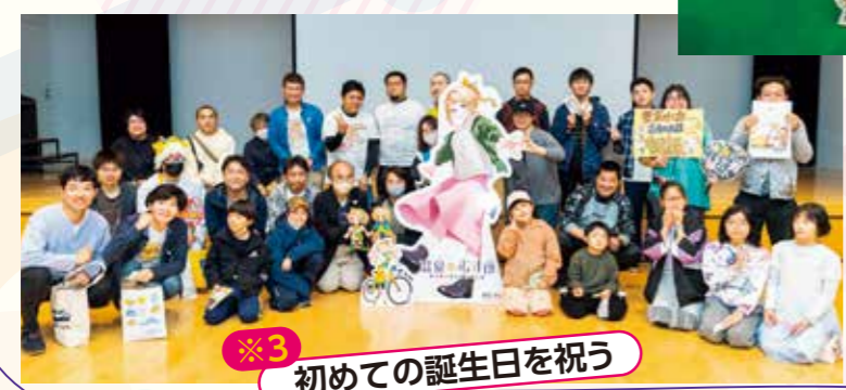
※3 初めての誕生日を祝う