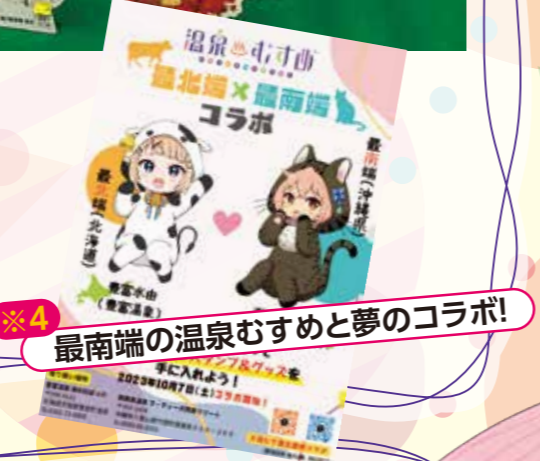
※4 最南端の温泉むすめと夢のコラボ!