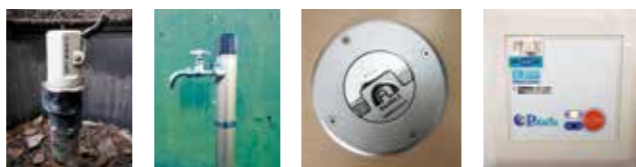
レバー式 不凍栓 フロアハンドル式 電動式 ※水抜きの種類によって水抜き方法が異なります。

(蛇口を全開に出しながら水抜き栓を閉める方法が一般的です。ですが、その際、中途半端に蛇口を開けると、水が完全に抜けきらず凍結の原因となりますのでご注意ください。)