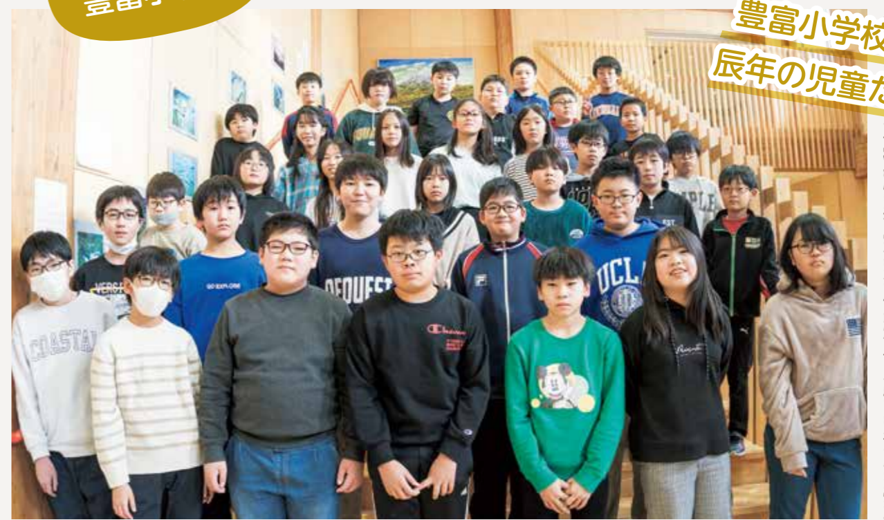
豊富小学校の 辰年の児童たち