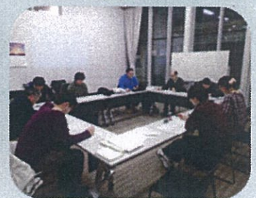
エコモー☆サポーター会議