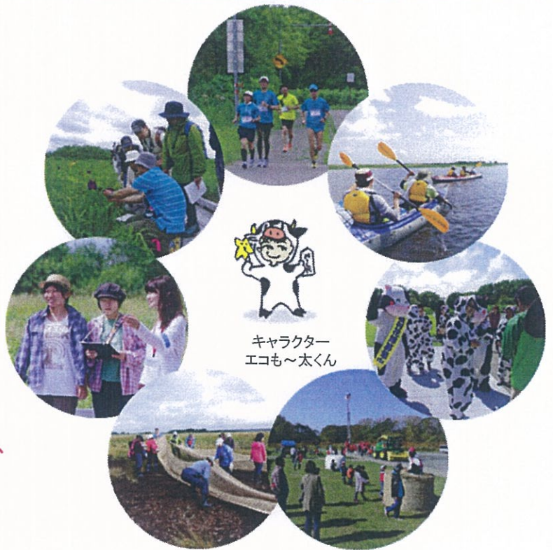
キャラクター エコも〜太くん

※エコモーとはエコロジーのエコと牛の鳴き声のモーからなる造語です。 地域と自然が元氣な、そんなサロベツにしていきたいという願いが込められています。