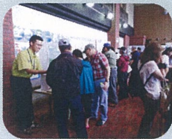
ホッキ祭でのPR活動