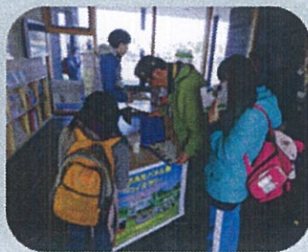
エコモー-DayでのPR活動