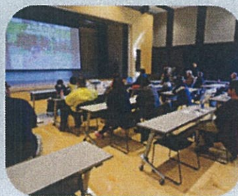
活動報告会の開催