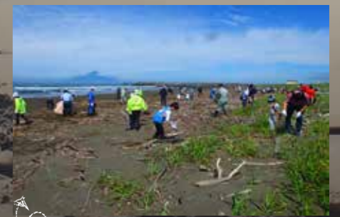
地域の連携で行われる海岸清掃

今回目標として掲げた「サロベツを好きな人を増やす」「サロベツを次の世代に伝える」ということは、自然再生に限らず、「まちづくり」、「観光」、「社会教育」などの分野でも同じことがいえます。新しいエコモースターメンバーの参加により活動の幅が広がり、より多くの人たちの参加が得られるようになれば、自然再生のための活動をより一層魅力的に展開することが可能になり、大きな効果を得ることができるでしょう。エコモースタープロジェクトは、自然再生を軸とした活動を展開し、他の様々な分野でサロベツに対する思いを共有できる人たちと協力・連携し合いながら進めます。