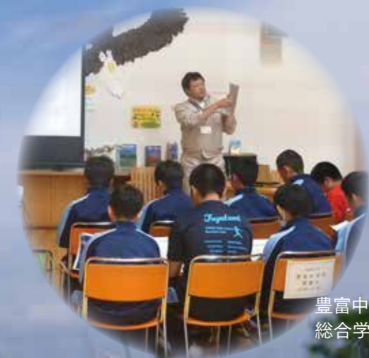
豊富中学校の 総合学習の様子

サロベツを次の世代に伝えるということの中には、サロベツの良かった風景が昔話にならないように自然を保全・再生することや、祖父母やさらにそのご先祖様がサロベツで培ってきた湿原との共生の歴史や思いを伝えていくことも含まれています。自然再生というとむずかしく考えがちになりますが、サロベツを次の世代に伝えるため、一人一人ができることに取り組んでいけるようになること、それが普及活動における自然再生活動そのものです。