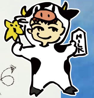
活動のマスコット エコも〜太くん