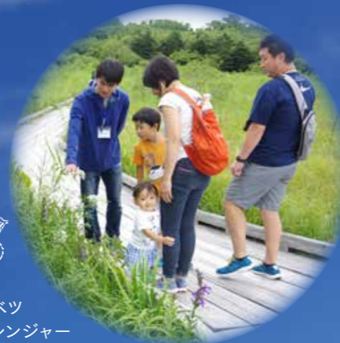
サロベツ サブレンジャー による木道ガイド