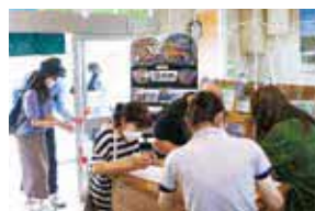
マンホールカード配布の様子

※各施設が臨時休業となり急遽配布ができない場合には、豊富町役場にて配布いたします。役場建設課上下水道係へお越しください。