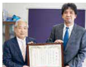
令和3年3月に豊富町産廃処理協同組合より下水道観光振興として多額の寄附をいただきました。