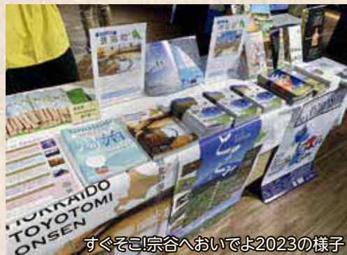
すぐそこ!宗谷へおいでよ2023の様子