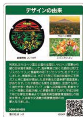
今回発行(2種類目)のマンホールカード ※左は表面、右は裏面