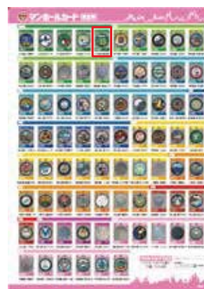
1種類目発行時(平成30年8月)当時の全国向けチラシ