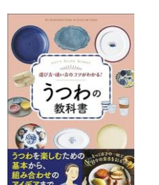
選び方・使い方のコツがわかる! うつわの教科書