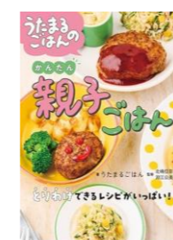
うたまるごはんのかたん親子ごはん