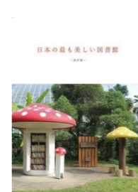
日本の最も美しい図書館 改訂版