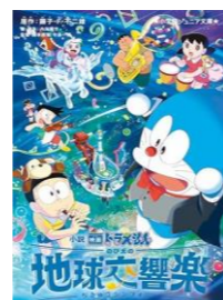
小説 映画ドラえもん のび太の地球交響楽