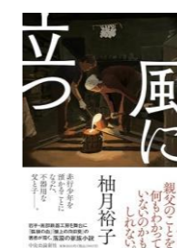
風に立つ / 袖月 裕子