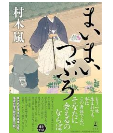
まいまいつぼろ / 村木 嵐