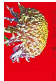
ツミデミック / 一穂 ミチ