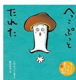
たれた へっこぶっと / こが ようこ