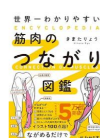
世界一わかりやすい 筋肉のつながり図鑑