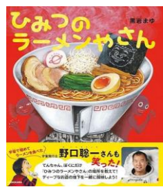
ひみつのラーメンやさん / 黒岩 まゆ