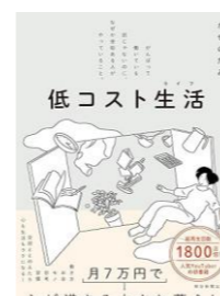
低コスト生活 / かぜのため

絶景の中で暮らすエゾモモンガ、エゾフクロウなどのかわいい道産子動物も収録した写真集です。