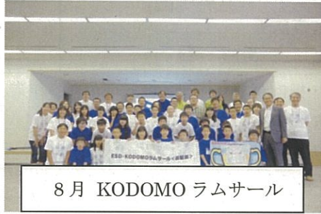
8月 KODOMO ラムサール