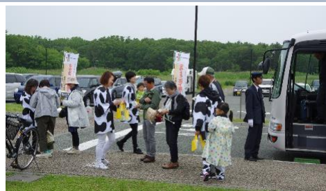
ゴミのポイ捨て防止啓発活動