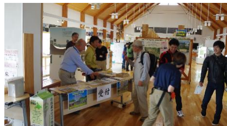
サロベツ・エコモーDay