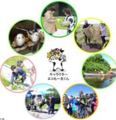
※上の写真はお城で行われている活動の一部です。

※エコモ-とはエコロジーのエコと年の経過のモ-からなる造語です。地上と自然が共存、そんなサロボツにしたいという思いが込められています。