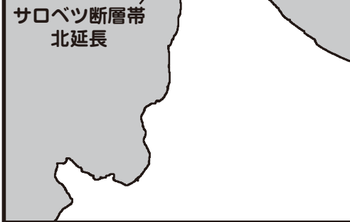
サロベツ断層帯 北延長

この震度マップに示された震度は、サロベツ断層帯による地震の震度を示しています。 なお、この震度は、北海道が実施した平成 28 年度地震被害調査による資料に基づいています。