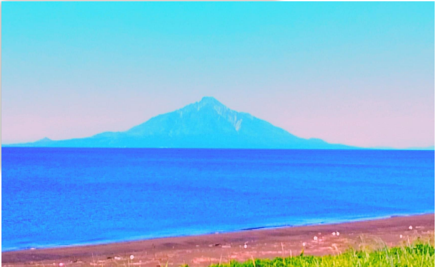
△ オロロンラインから見える利尻富士