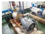
目梨別 ポンプ場 (福永)