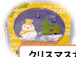
クリスマスカード