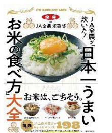
JA全農が炊いた! 「日本一うまいお米の食べ方」大全