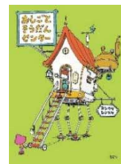
おしごとそうだんセンター /ヨシタケ シンスケ

「足が速くなりたい」「頭がよくなりたい」「風邪を治したい」、そんなときに、身体を助けてくれる食べ物は何? 食べ物や栄養素だけでなく、身体のおしくみについても学べる!