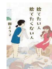
捨てたい人 捨てたくない人/ 群 ようこ