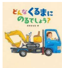
どんなくるまに のるでしょう? /鈴木 まもる