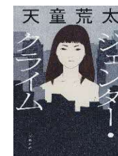
ジェンダー・クライム / 天童 荒太