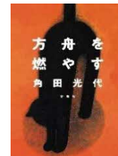
方舟を燃やす / 角田 光代

1960年代アメリカ、才能ある化学者ながら無職のシングルマザーの転職先は、料理番組! テレビ局の要望を無視して、科学的に料理を説くエリザベス。しかし意外にも、それが視聴者の心をつかんでいく……。