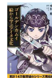
ゴールデンカムイ 絵から学ぶ アイヌ文化/中川 裕