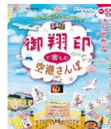
るるぶ御翔印で楽しむ 空港さんぽ

続けることへの苦手意識がなくなる! もはや継続が趣味になる! 「習慣の本」なのに、なぜかクスッと笑えて泣ける画期的な1冊です。