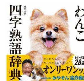
わんこ四字熟語辞典 /西川 清史