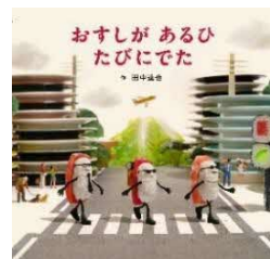
おすしが あるひ たびにでた /田中 達也