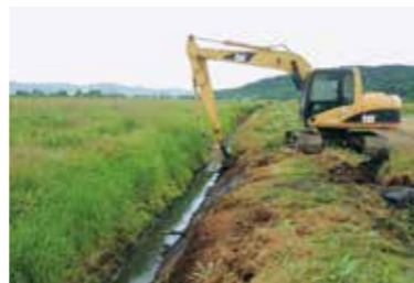
明渠排水路の作業風景

なお、平成29年度の概要および交付面積と交付額、集落協定の締結者数および農業者への交付額などについては、役場農林水産課において閲覧できます。