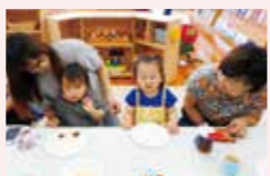
今回はパイを焼き、おしゃやれなティータイム