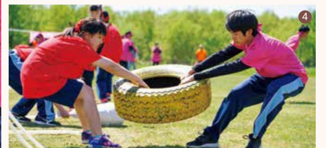
①【豊中】学年同士のガチンコ勝負!「学年対抗綱引き」 ②【豊中】全員の心を一つに駆け抜ける「〇人×脚」 ③【豊中】倒れても諦めない!「大谷校長杯」(コスプレ部門) ④【豊中】壮絶な奪い合いが繰り広げられた「マッチョdeファイト」