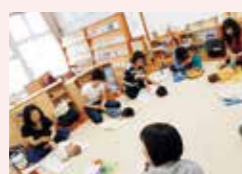
今月のテーマ「ベビーマッサージ」助産師さんが講師でしてくれました。