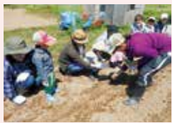
ジャガイモ、枝豆、人参をみんなで育てるよ。