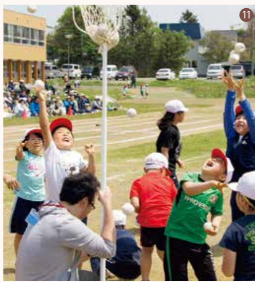
⑤【兜沼】昨年度優勝チームからの優勝旗返還 ⑥【兜沼】力の続く限り飛び続ける「班対抗長縄跳び」 ⑦【兜沼】あなたの運は?「宝曳きで運試し」 ⑧【兜沼】親子で息を合わせて「大玉ころがし」 ⑨【豊小】チームを背負って走り抜け「紅白対抗選手リレー」 ⑩【豊小】チームの勝利を目指して応援だー! ⑪【豊小】1つでも多くの玉をかごの中に「ねらいうち」