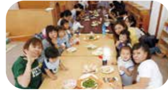
●マッシュポテトでうさぎを作ってお月見を楽しみました(15組参加)