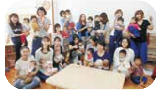
●10月のテーマは「手作りおもちゃ作り」