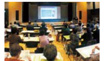
生前整理講座会場の様子

ノートは「死」をみつめるのではなく「未来をどう生きるか」を考えることです。今日からの人生をどう過ごしたいか？生きたいか？を考える機会としてノートを活用してみてください。豊富町では、町民の皆さまが「想いを残す・伝える」お手伝いの一つとして、講座でも使用した、ノートを無料にて提供しております。担当者より簡単なノートについての説明をさせていただいてからお渡ししておりますので、これからノートを記載してみたいという方がありましたら、保健センターまでお問い合わせください。