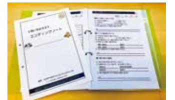
講座で使用したエンディングノート