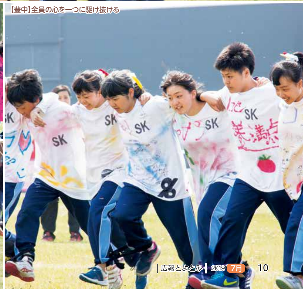
【豊中】全員の心を一つに駆け抜ける