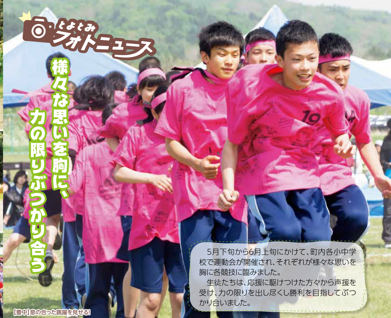
【豊中】息の合った跳躍を見せる!