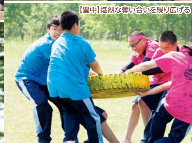
【豊中】熾烈な奪い合いを繰り広げる