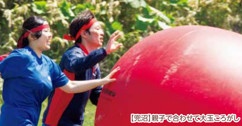
【兜沼】親子で合わせて大玉ころがし