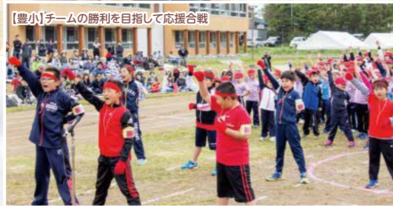
【豊小】チームの勝利を目指して応援合戦