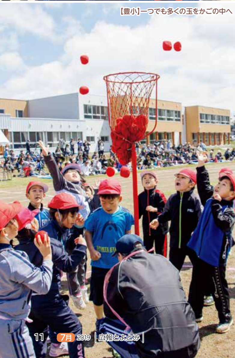
【豊小】一つでも多くの玉をかごの中へ