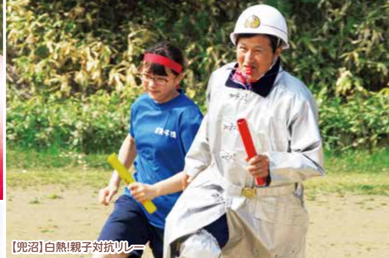
【兜沼】白熱!親子対抗リレー