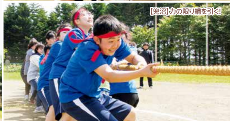
【兜沼】力の限り綱を引く!