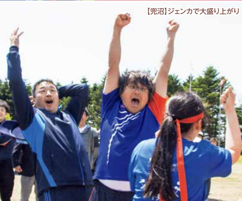
【兜沼】ジェンカで大盛り上がり