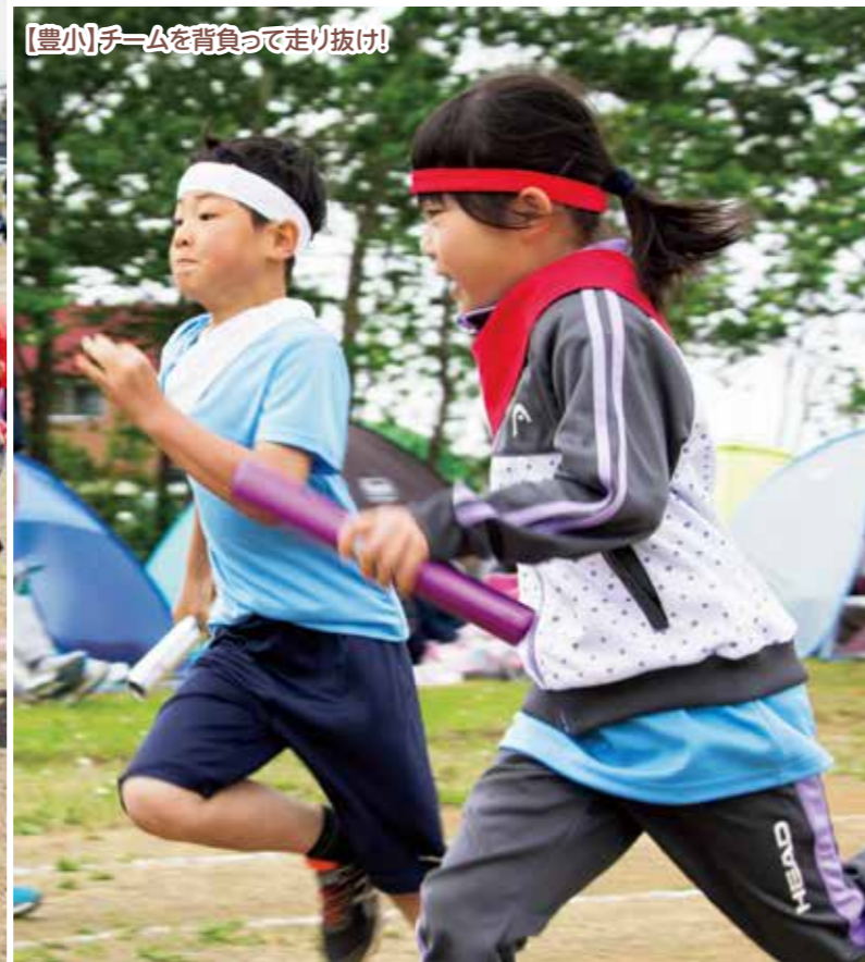
【豊小】チームを背負って走り抜け!