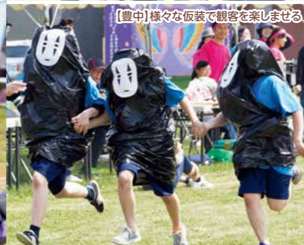
【豊中】様々な仮装で観客を楽しませる