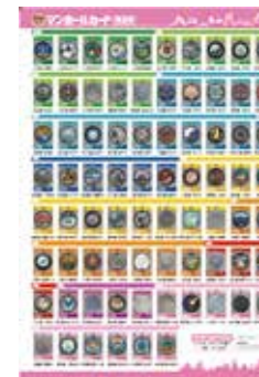
初回発行時(平成30年8月)当時の全国向けチラシ