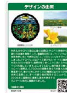
今回増刷(2回目)のマンホールカード ※左は表面、右は裏面