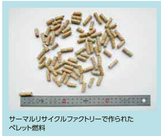
サーマルリサイクルファクトリーで作られたペレット燃料

※サーマル・リサイクルとは、『熱回収』または、『エネルギー回収』という意味で使われておりますが、ほかにも『廃棄物を処理し、助燃材などの固形燃料を作り出すこと』などもサーマル・リサイクルと捉えられております。