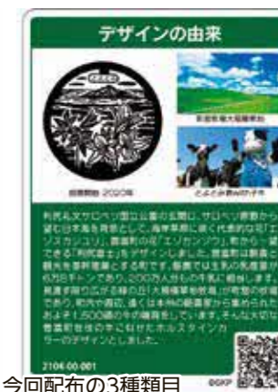
今回配布の3種類目