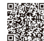
広報紙「ほっかいどう」

※「Hokkaido ebooks」をスマートフォン・タブレットでご覧いただく場合は専用アプリが必要です。