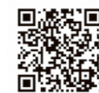
電子書籍ポータルサイト「Hokkaido ebooks」