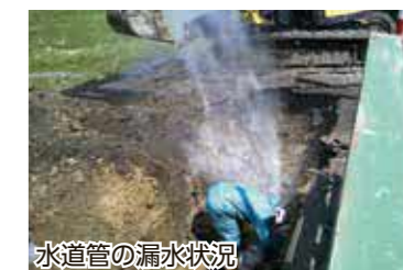
水道管の漏水状況