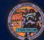
豊富町観光情報センター 北海道豊富町豊富1-1-1 0162-82-1001