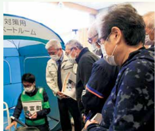
が行えるよう、戸別受信機の設置を段階的に進めて参ります。

本町においては、特に大雨による被害が懸念されることから、引き続き、地域防災計画の見直しやハザードマップを活用した防災講話の継続、定期的な避難訓練に努めて参ります。また、防災情報の速やかな伝達