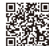
全国家計構造調査 キャンペーンサイト